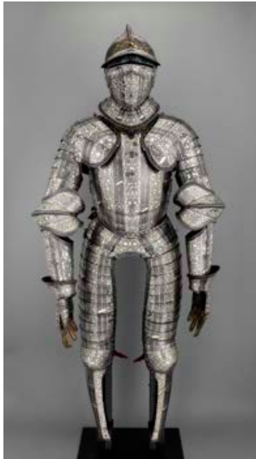
Armure du dauphin Henri, futur Henri II

L' emblématique royale française montre le large spectre d'utilisation des armes royales comme de la devise et du chiffre de chaque souverain, pour sa personne ou au contraire comme marque d'identification des officiers royaux. Le pivot en est l'exceptionnelle armure du dauphin Henri, futur Henri II (musée de l'Armée) où le décor damasquiné utilise les couleurs choisies par le prince que s'était voué à la lune et à sa déesse.