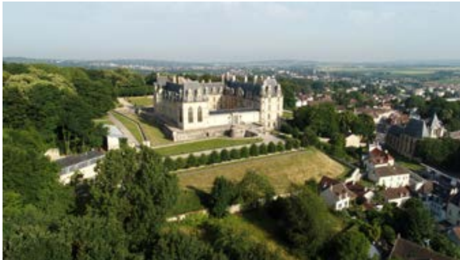
Vue du château

Décidée en 1969 par André Malraux, ministre chargé des Affaires culturelles, la création du musée national de la Renaissance résulte de deux facteurs convergents :