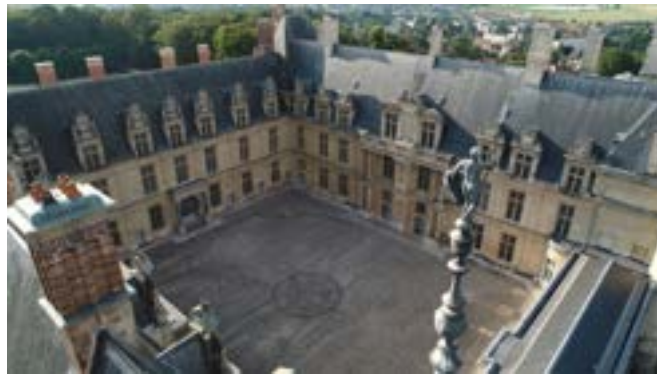
Vue de la cour du château

Il présente en outre l'originalité d'être un château semi-royal dans lequel des appartements sont aménagés spécifiquement pour Henri II et Catherine de Médicis : escalier royal, salle d'honneur, antichambre, chambre, garde-robe et cabinet.