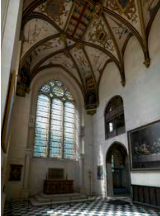
Vue de la chapelle

Non seulement l'usage de l'héraldique reste aussi présent et habituel à la Renaissance qu'il l'était à la fin du Moyen-Âge mais bien des aspects en apparaissent encore dans notre quotidien du XXI e siècle.