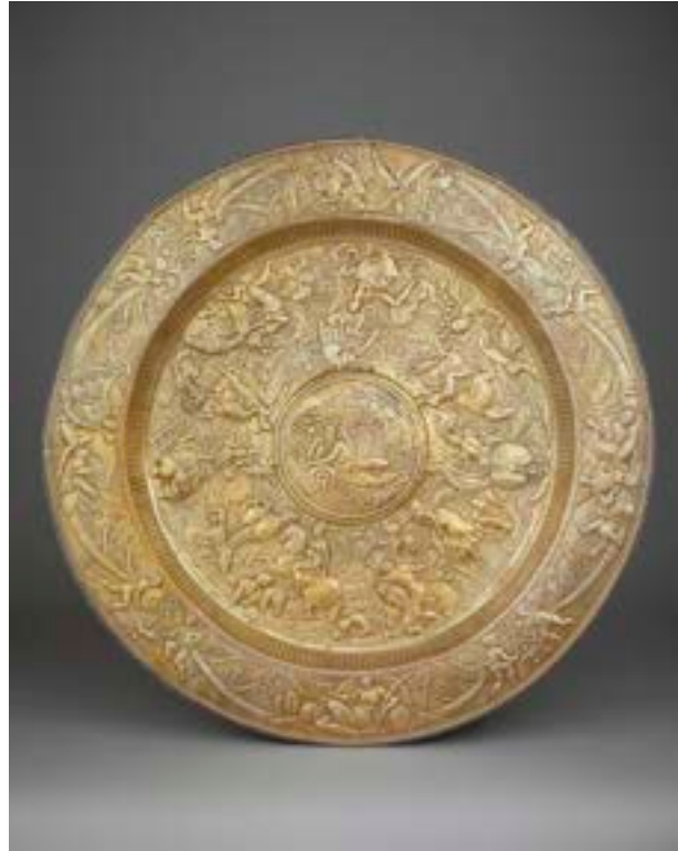
Bassin aux armes des Gondi

La chambre de Catherine de Médicis propose d'apprécier dans son inventivité l' héraldique comme décor , lorsque les blasons, les devises et les chiffres se combinent avec un décor ornemental et se substituent même quelque fois à lui. Le grand bassin doré lié aux Gondi (département des Objets d'art du musée du Louvre) va même jusqu'à rendre presque invisibles les marques héraldiques inscrites dans sa riche ornementation.