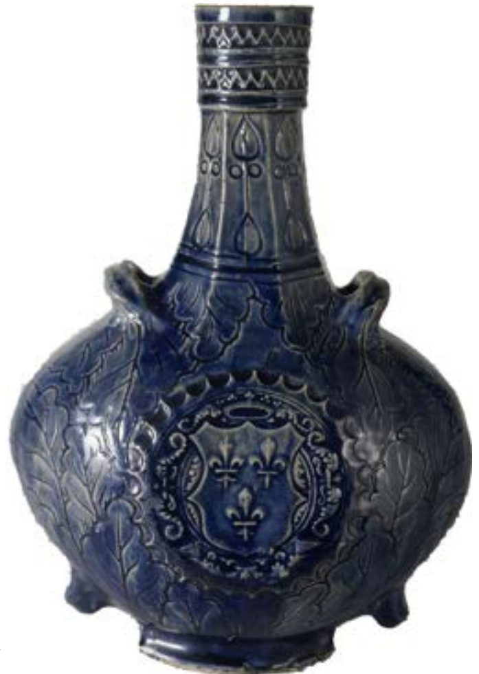
Bouteille émaillée Saint Vérain aux armes de France

Blois – Château royal de Blois Charenton le Pont – Médiathèque du patrimoine et de la photographie Chartres – Trésor de la cathédrale Notre-Dame Crépy-en-Valois – Musée de l'Archerie et du Valois Draguignan – Musée des Beaux-Arts Écouen – Musée national de la Renaissance Fontainebleau – Château de Fontainebleau Langres – Bibliothèque Marcel-Arland Langres – Musée d'Art et d'Histoire Langres – Trésor de la cathédrale Saint-Mammès Limoges – Musée des Beaux-Arts Lyon – Musée des Beaux-Arts Paris – Musée de Cluny – musée national du Moyen Âge Paris – Musée de la Musique Paris – Musée de l'Armée Paris – Musée de l'Armée – Bibliothèque Paris – Musée des Arts décoratifs Paris – Musée du Louvre – Département des Objets d'art Paris – Musée du Louvre – Département des Sculptures Paris – Musée du Louvre – Service de l'Histoire du Louvre Paris – Petit Palais – musée des Beaux-Arts de la Ville de Paris Poitiers – Musée Sainte-Croix Saint-Germain-en-Laye – Bibliothèque municipale Sèvres – Cité de la céramique Talcy – Château (Centre des monuments nationaux)