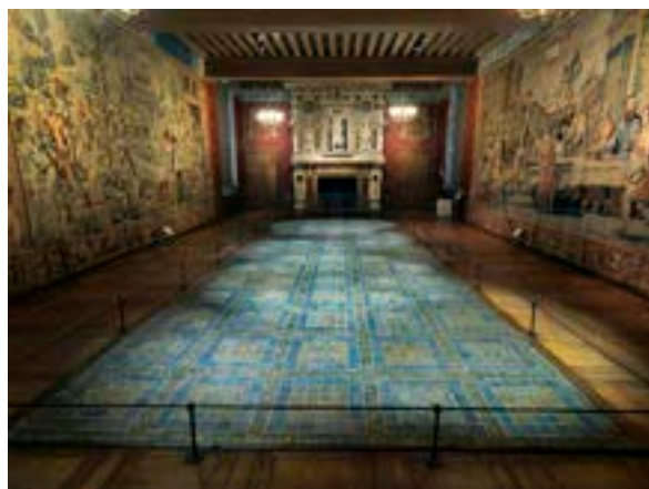
Grande salle du Roi

Pavements polychromes, vitraux héraldiques en grisaille et jaune d'argent, lambris dorés, bustes en bronze et serrures en ferronnerie décorative venaient parachever ce programme décoratif d'exception. Ces œuvres mobilières préservées ont intégré les collections nationales et sont présentées dans le circuit de visite.