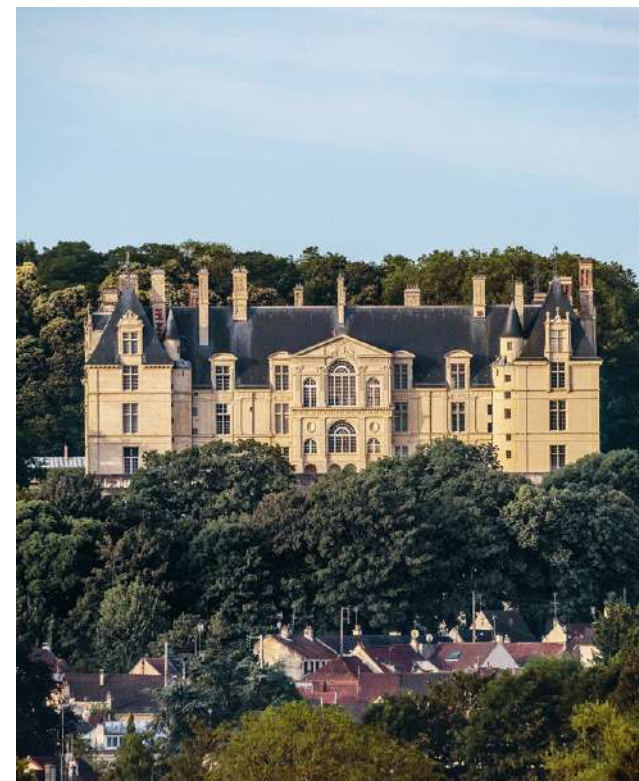
Vue de l'aile nord du château

D'une superficie actuelle de 19 hectares, au sein des 104 hectares de la forêt d'Écouen riche de nombreuses essences, le domaine présente des jardins restitués d'après le dessin de Jules Hardouin-Mansart.