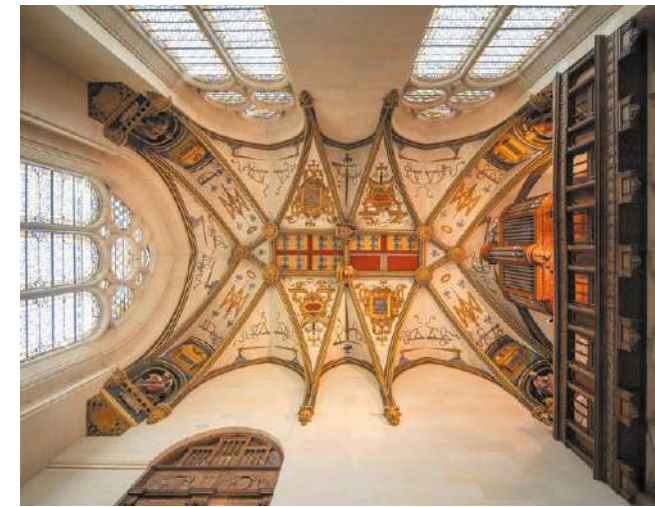
Plafond de la chapelle

La prestigieuse collection d'arts décoratifs du musée national de la Renaissance est exposée au sein du château d'Écouen de manière à évoquer un intérieur princier dans un parti muséographique où peintures, mobilier, orfèvrerie, céramique, verrerie, émaux peints, tapisseries et tentures de cuir répondent à l'architecture et au décor intérieur, notamment au premier étage, pour une perception saisissante de l'esprit artistique et de l'art de vivre à la Renaissance.