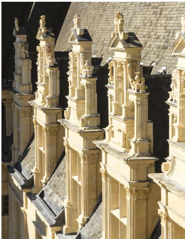
Les lucarnes restaurées de l'aile ouest

CERTAINES SALLES SONT SUSCEPTIBLES D'ÊTRE FERMÉES. DES ŒUVRES PEUVENT ÊTRE DÉPLACÉES OU MISES EN RÉSERVE. LE PARCOURS DE VISITE EST DONC ÉVOLUTIF.