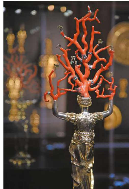
Daphné, Wenzel Jamnitzer, vers 1569-1576

AUJOURD'HUI, LE MUSÉE ENTRETIENT UN DIALOGUE PERMANENT ENTRE SES COLLECTIONS ET LE CHÂTEAU EN ÉVOQUANT L'AMEUBLEMENT D'UNE GRANDE DEMEURE ET EN RACONTANT LA CIVILISATION DE LA RENAISSANCE EUROPÉENNE.