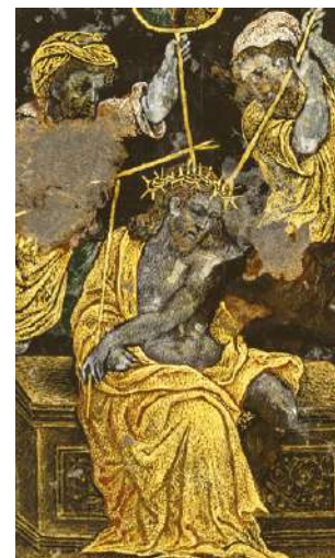
Acquisition 2023. Le Christ aux outrages