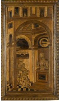
Panneau de stalle, Fondation d'un monastère en Palestine par Saint Jérôme, Italie du nord, fin XV e , début XVI e siècle