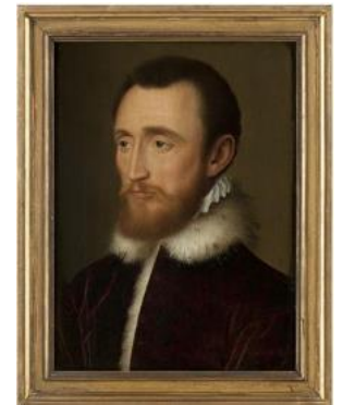
Clouet (atelier), portrait de Jacques de Brouillard, vers 1551

•Un portrait en buste de femme , du peintre florentin Giuliano Bugiardini, probablement de fantaisie, définit la beauté idéale conjugée à la vertu. La main de la femme saisit de façon assez réaliste l'appui de fenêtre constituant le premier plan du tableau. On peut noter aussi la manche amovible, très évidente caractéristique de la mode de l'époque.