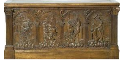
Moderno(d'après), coffre, les Travaux d'Hercule, 1546

•Un coffre de 1546 présente en façade un alignement d'arcades qui abritent des scènes des travaux d'Hercule inspirées de réalisations de l'orfèvre Galeazzo Mondella, dit Moderno .