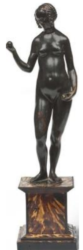
Conrad Meit(entourage), statuette d'Ève, après 1504

Dans tous les cas, l'étude de ce type de pièces est extrêmement difficile sans recourir à des procédés d'analyse scientifique. Philippe Malgouyres a publié un catalogue des bronzes italiens de la Renaissance conservés au Louvre en 2020.