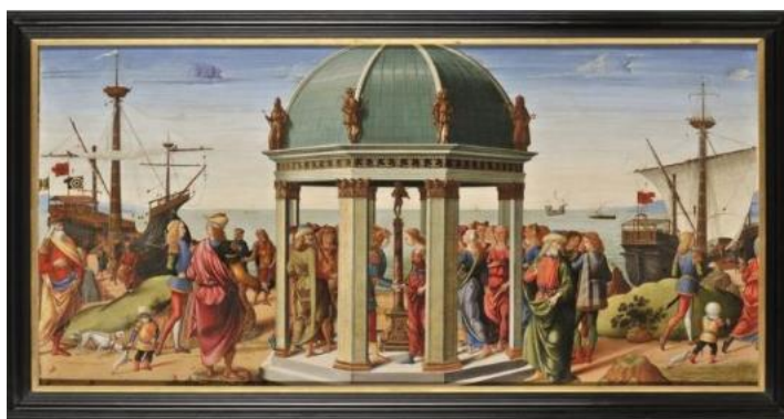
Biagio d'Antonio (attr.), panneau, La rencontre de Jason et Médée, vers 1446-1486

•Un panneau de bois d'un cycle décoratif de l'histoire de Jason, attribué à Biagio d'Antonio, illustre la rencontre de Jason et Médée dans un édifice circulaire à l'antique, censé être le temple d'Apollon. La mythologie se conjugue aux références à l'antique et au sens de la perspective.