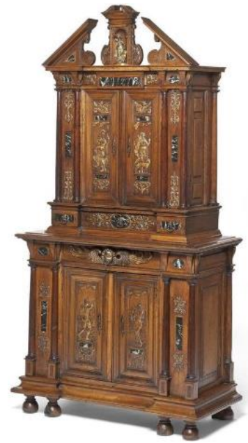
Armoire à deux corps, Pallas Athéna, Diane, Aurore et Proserpine, Île de France, fin du XVI e siècle

•Une armoire à deux corps d'Île de France est parfois donnée à la Bourgogne, ou à la Normandie. Elle met en scène Pallas Athénée, Diane, Proserpine et l'Aurore, traitées dans un esprit hérité des ornemanistes de Fontainebleau, ou, pour prendre une référence plus proche des années 1580, du peintre, dessinateur et graveur hollandais Hendrick Goltzius, peut-être par l'intermédiaire du flamand Philippe Galle. Le traitement de l'armoire est très architecturé, présentant, en partie haute, un fronton brisé, avec un édicule contenant une figure de bronze. Des bas-reliefs dorés et des incrustations de marbres animent la façade