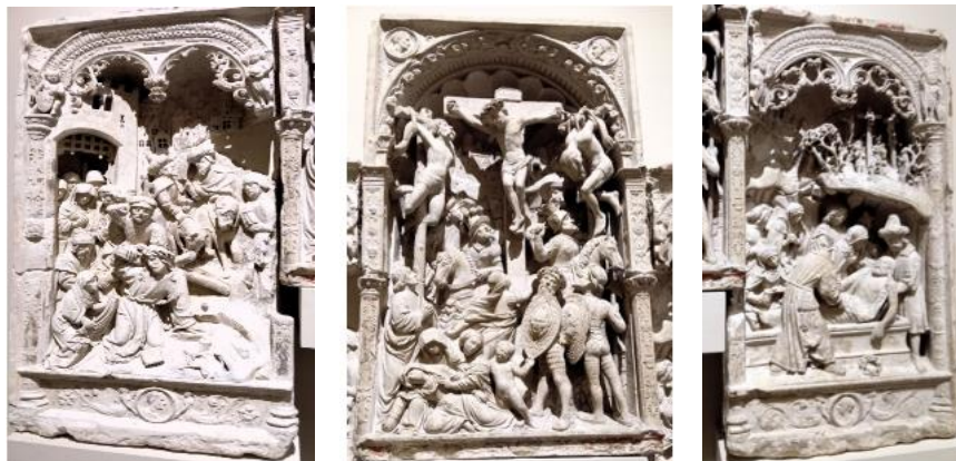
Retable sculpté, la Nativité, la Crucifixion, la Mise au tombeau, Champagne, 1522

•En face du précédent, un retable de bois sculpté, d'origine aveyronnaise, montre la Nativité , la Crucifixion et l' Assomption - qui n'est pas un thème évangélique. Cette œuvre illustre bien l'adaptation des arts régionaux – on y voit les armes d'un notable rouergat, Antoine de Lescure - à l'influence italienne, avec la présence d'un riche cadre architectural, de colonnettes imitant des candélabres, de motifs de coquilles. Les pilastres ou colonnettes à candélabres disparaissent dans les années 1520-1530. Le caractère régional réapparaît par certains détails, comme la petite guimpe coiffant l'un des personnages féminins.