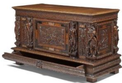
Coffre la Mort d'Adonis, Normandie ? deuxième moitié du XVI e siècle

• Un coffre de la fin du XVI e siècle illustre le mythe d'Adonis, dont la beauté avait suscité à la fois l'amour de Vénus et de Perséphone. Pour partager les deux déesses, un tribunal divin avait réparti l'existence du jeune homme entre le monde terrestre et les enfers, évocation d'rythme des saisons. Mais la jalousie d'une divinité tierce, différant selon les versions, l'avait fait tuer par un sanglier lors d'une partie de chasse.