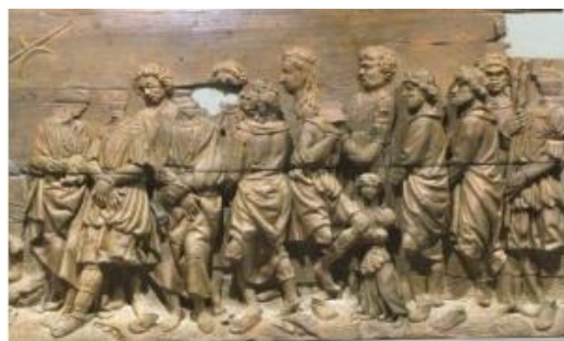
Bas-relief (détail), Porteurs de vaisselles précieuses suivis des bœufs du sacrifice et d'un groupe de prisonniers, vers 1505-1520