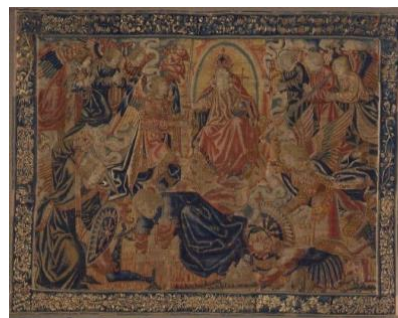
Tapisserie la Chute de l'ange pécheur, Bruxelles, vers 1550

•Une chute de l'ange pécheur , tissée à Bruxelles, aux environs de 1550, est l'une des 10 pièces exposées de l'ensemble d'une collection comprenant environ 130 tapisseries.