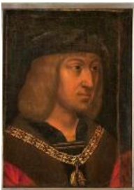
Portrait de Maximilien Ier, Flandres, fin XV e siècle

•On peut mentionner, bien que non présenté actuellement, un portrait qui est la copie d'un original de Titien, probablement disparu dans le grand incendie de l'alcazar de Madrid en 1734, celui de Marie de Hongrie , sœur de Charles Quint et gouvernante en son nom des Pays-Bas durant plus de trente ans. Elle y porte la tenue de veuve qu'elle n'a plus quittée après la disparition de son mari, Louis II Jagellon, roi de Hongrie, tué à la bataille de Mohacs en 1526 contre les Turcs.