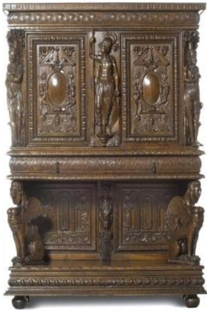
Armoire dresseur aux sphinges, avec Pallas Athéna, vers 1580

•Une armoire reprend les codes de Jacques Androuet du Cerceau et de Hugues Sambin, tous deux ayant entretenu des liens avec l'école de Fontainebleau : figures canéphores, serpents (particulièrement chez Hugues Sambin)... On trouve aussi ici une représentation de Pallas Athéna et des miroirs bombés, peut-être peints à l'origine. Les entablements sont à godrons et palmettes. Une publication récente a été consacrée à Hugues Sambin, en 2025.