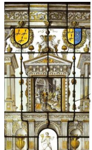
Dirck Crabeth (atelier), vitrail de l'Onction, 1543

• Un bel ensemble de vitraux en grisaille et jaune d'argent, adapté à des fenêtres à croisées, rares pour cette époque, a été réalisé en 1543 par le peintre en vitrail hollandais Dirck Crabeth, pour le vestibule de l'académie de peinture et dessin Pax Huic Domi de Leyde. Un hommage indirect et tardif a été rendu à cet artiste récemment, dont un dessin préparatoire a été vendu 200 000 € sur le marché de l'art ! L'iconographie religieuse comprend deux séries : une Histoire de Samuel , pour l'Ancien Testament, et une Histoire de saint Paul .