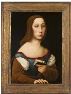
Giuliano Bugiardini, portrait de femme, vers 1510-1515

•Un portrait de l'atelier de Clouet est celui de Jacques de Brouillard , époux de Charlotte de Pisseleu, sœur de la duchesse d'Étampes, favorite de François Ier.