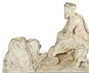
Élément de retable, le Lavement des pieds, Flandre, fin du XVI e siècle

•Plusieurs fragments de sculptures d'albâtre gypseux proviennent de l'ancienne cathédrale de Cambrai, détruite à la Révolution. Ils montrent d'ailleurs des traces de destructions mécaniques et de coulures. Deux d'entre eux, probablement datables de la fin du XVI e siècle, ils représentent saint Jean-Baptiste pour l'un, et le Lavement des pieds pour l'autre, mais où réapparaît saint Jean-Baptiste. Une étude thématique de l'iconographie de saint Jean-Baptiste à l'ancienne cathédrale de Cambrai n'a pas permis de déterminer un emplacement précis, deux ou trois chapelles demeurant possibles. La question de l'appartenance des deux fragments à un même retable reste posée. Une vingtaine de pièces sont connues, de l'ancienne cathédrale de Cambrai, conservées aujourd'hui aux musées de Cambrai et Lille, aux Arts décoratifs, au Louvre dont un Dieu le Père, contemporain des albâtres et un Christ du XVII e siècle.