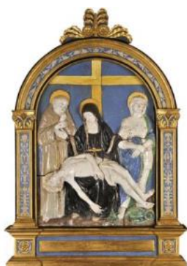
Baglioni (atelier), relief, Déploration sur le Christ mort, vers 1520

•Une grande Déploration en terre cuite émaillée, très proche de l'art des Della Robbia, est plus probablement attribuable à l'atelier des Buglioni.