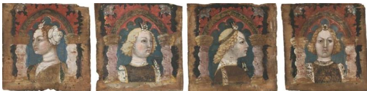
Bonifacio Bembo (atelier), éléments de plafond, vers 1460-1470

•La partie haute des cimaises aligne une série de closoirs, ces panneaux d'ornement de plafonds à la jointure des murs et du plafond. Ils sont dus à l'atelier lombard de Bonifacio Bembo, connu aussi pour les éléments d'un triptyque conservé au Petit Palais d'Avignon et, de manière plus originale, pour une série de cartes à jouer à destination de la cour de Milan. Ces closoirs de bois résineux montrent des portraits fantaisistes et symboliques, avec des typologies spécifiques, produits en série, peut-être à l'aide de pochoirs. S'ils proviennent bien du monastère de la Colombe à Crémone, ils témoigneraient, du fait de leur typologie, de la préexistence d'un bâtiment civil antérieur au monastère.