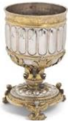
Ludwig Krug(entourage), gobelet, vers 1530

•Un gobelet d'argent, en partie doré, produit dans l'entourage de l'orfèvre Ludwig Krug, de Nuremberg, l'a peut-être été d'après un modèle gravé d'Albrecht Altdorfer.