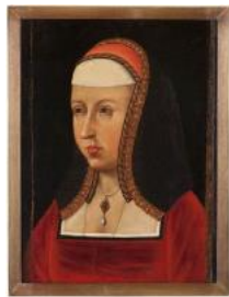
Portrait de Marie de Bourgogne, Flandres, fin XV e siècle

•Deux petits panneaux voisins présentent les portraits de ses grands-parents : l'empereur Maximilien Ier et son épouse, Marie de Bourgogne , fille du duc Charles le Téméraire.