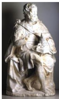
Élément de retable, Saint-Jean-Baptiste, Flandre, fin du XVI e siècle

•Plusieurs fragments de sculptures d'albâtre gypseux proviennent de l'ancienne cathédrale de Cambrai, détruite à la Révolution. Ils montrent d'ailleurs des traces de destructions mécaniques et de coulures. Deux d'entre eux, probablement datables de la fin du XVI e siècle, ils représentent saint Jean-Baptiste pour l'un, et le Lavement des pieds pour l'autre, mais où réapparaît saint Jean-Baptiste. Une étude thématique de l'iconographie de saint Jean-Baptiste à l'ancienne cathédrale de Cambrai n'a pas permis de déterminer un emplacement précis, deux ou trois chapelles demeurant possibles. La question de l'appartenance des deux fragments à un même retable reste posée. Une vingtaine de pièces sont connues, de l'ancienne cathédrale de Cambrai, conservées aujourd'hui aux musées de Cambrai et Lille, aux Arts décoratifs, au Louvre dont un Dieu le Père, contemporain des albâtres et un Christ du XVII e siècle.