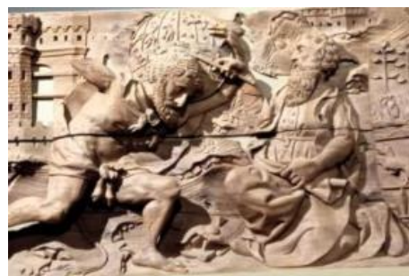
Bas-relief (détail), Hercule portant la terre, vers 1505-1520

Société des Amis du musée national de la Renaissance au château d'Écouen