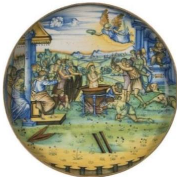
Plat, le Martyre de Sainte Cécile, atelier Pirotta, Faenza, vers 1525

•La collection de majoliques des Arts décoratifs est relativement réduite mais bénéficie de dépôts du Louvre. Elle présente des pièces d'Urbino, de Casteldurante, Faenza, Deruta... Le Martyre de sainte Cécile, de l'atelier Pirotta, de Faenza, a figuré dans le legs d'Alexandrine Grandjean. Une coupe d'accouchée, montrant une femme guidant un enfant , pourrait provenir de l'atelier des Patanazzi, à Urbino, illustrée peut-être d'après un modèle gravé de Marcantonio Raimondi.