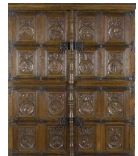
Armoire d'apparat, vers 1510

• Une armoire à quatre vantaux, acquise grâce au mécénat de Michel et Hélène David-Weill, peut être datée de 1500-1510. Elle présente des caractères encore gothiques : raideur des lignes, type de pentures et panneaux des côtés à décor en plis de serviette. La façade, en revanche, ornée de seize médaillons enfermant des bustes profilés sur fond de rinceaux, est d'un esprit plus nouveau. Le système d'ouverture des vantaux par rotation à double révolution - se repliant sur eux-mêmes - remonte au XV e siècle.