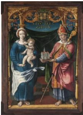
Maître de Dinteville (Bartholomeus Pons?), bannière d'église, Saint Germain offrant une église à la Vierge , 1536

Bien qu'importantes, certaines œuvres n'ont pas été commentées en raison d'un défaut rédhibitoire : celui d'être d'une période antérieure à celle qui nous réunit, notamment un grand retable de Luis Borrassà et un d'Antonio de Carro, des XIV e et XV e siècles !