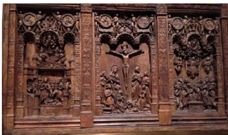
Retable sculpté, la Nativité, la Crucifixion, l'Assomption, Ronergue, début du XVI e siècle

•En face du précédent, un retable de bois sculpté, d'origine aveyronnaise, montre la Nativité , la Crucifixion et l' Assomption - qui n'est pas un thème évangélique. Cette œuvre illustre bien l'adaptation des arts régionaux – on y voit les armes d'un notable rouergat, Antoine de Lescure - à l'influence italienne, avec la présence d'un riche cadre architectural, de colonnettes imitant des candélabres, de motifs de coquilles. Les pilastres ou colonnettes à candélabres disparaissent dans les années 1520-1530. Le caractère régional réapparaît par certains détails, comme la petite guimpe coiffant l'un des personnages féminins.