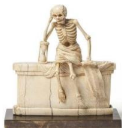
Statuette, squelette dans un linceul assis sur un tombeau, 1547

•Bien que n'ayant rien d'inférel, une petite figurine de squelette en ivoire sortant du tombeau a trouvé sa place parmi les arts du feu ! Symbolisant le passage du temps, elle illustre le goût des vanités, déjà répandu, auxquelles la fondation Bemberg à Toulouse a consacré une exposition en 2018. Une inscription en français la date de 1547. Pour l'anecdote, c'est la date de la mort de François Ier, deux mois après qu'il s'était imprudemment réjoui de celle de son vieil adversaire : Henri VIII d'Angleterre !