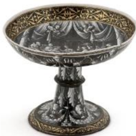
Pierre Reymond, coupe émaillée de Didon et Énée, Limoges, vers 1550

•Deux plaques représentant des sibylles , de Léonard Limosin, sont très proches de celles conservées à Écouen.