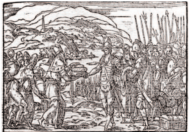
Abraham et Melchisédech, gravure de Bernard Salomon tirée des Quadrins historiques de la Bible édités à Lyon par Jean de Tournes, 1553.

L' Annonciation (E.Cl. 214) est un panneau sculpté et peint, réalisé en Italie au XVI e siècle.