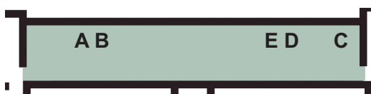
galerie des arts du feu