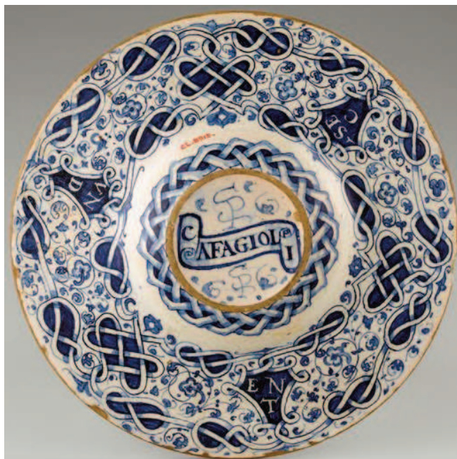
Revers du plat aux armes de Léon X (E. Cl. 8915) portant la signature Cafaggioli .

Les inscriptions portées au revers des pièces peuvent être des dates, des signatures, l'explication du sujet représenté sur la face ou une marque d'atelier quelquefois accompagnée du nom de la ville où l'œuvre a été faite : ainsi l'assiette aux armes du pape Léon X (E.Cl. 8915, E sur le plan, vitrine 18 en haut à droite) porte-t-elle au revers la marque SP et le nom de la ville de Cafaggiolo. C'est par ces inscriptions que l'on peut attribuer une importante production de majolique en France, à Lyon et à Nevers, à la fin du XVI e siècle, dont l'aspect stylistique n'offre guère de différence avec les réalisations d'Urbino.