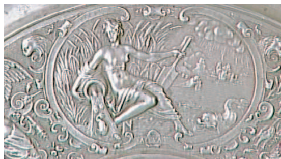
Détail du bassin de la Tempérance