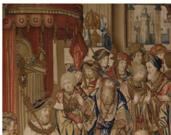
Représentation d'un dressoir sur la 5 ème pièce de la tenture de David et Bethsabée, présentée dans la Galerie de Psyché.

La collection présentée illustre bien cette production assez répétitive, fondée sur des modèles connus par des plaquettes, dont les plus célèbres sont les deux bassins ornés à l'ombilic de représentations du " Péché originel " (à gauche, E.Cl. 517) et de " la Tempérance " (à droite, E.Cl. 506a) associés à une aiguière à l'antique , à grotesques et allégories des quatre éléments (E.Cl. 506b). Ces