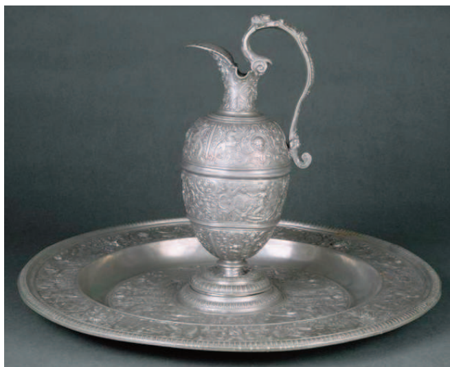
Bassin et aiguière de la Tempérance (E. Cl. 506 a et b), François Briot, seconde moitié du XVI e siècle.

monogramme. Ses modèles ont été ultérieurement reproduits, ici sur une coupelle aux rebords festonnés signée par Hans II Spatz, actif à Nuremberg de 1629 à 1670 (E.Cl. 15284). Une assiette du même potier, ornée au centre d'une représentation de "la Résurrection" et une autre, anonyme, présentant une scène de sacrifice , illustrent la tradition des représentations religieuses inspirées par les décors des patènes (E.Cl. 15288 et 519c). De même, la chope à bière de Heimeran Wildner le jeune (actif en Bohême de 1583 à 1610) est décorée, en dépit de son usage profane, de scènes de la Genèse tirées de plaquettes du deuxième tiers du XVI e siècle (E.Cl. 15468).